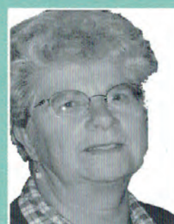
11 Frouchien Polman Buurtorganisatie's