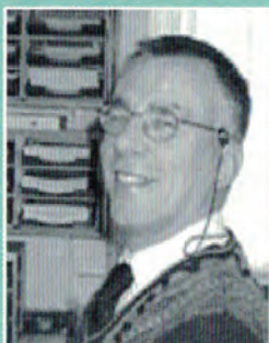
13 Jan Walburg Financiën