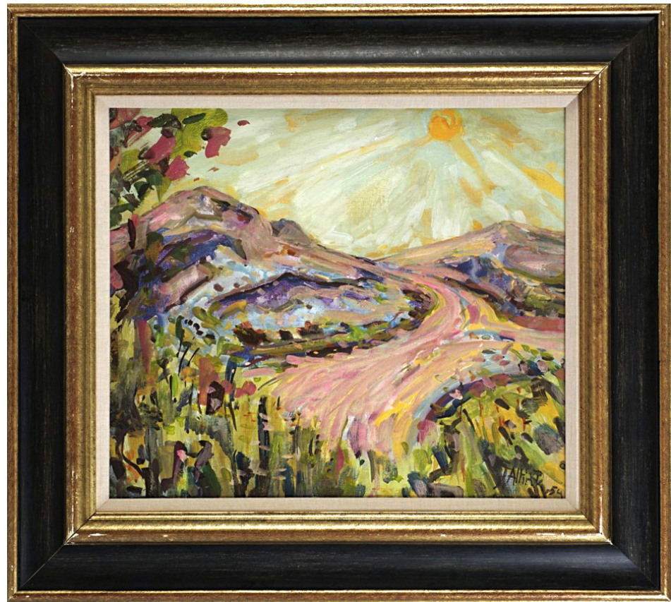
Schilderij 'Heuvellandschap Pic de Luc', ook genoemd 'Berglandschap', 'Heuvellandschap', 'Mediterraan landschap'. Gesigneerd rechts onder: 'J. Altink' 40 x 46.5 cm

Vijfentwintig argumenten waarom het schilderij 'Heuvellandschap' ('Pic de Luc') een vervalsing is: