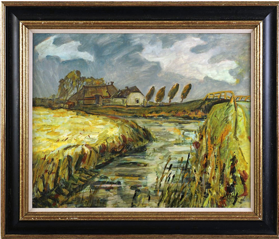
Schilderij ‘Het Reitdiep’, ook genoemd ‘Huizen met een bruggetje aan vliet’. Gesigneerd rechts onder: ‘J. Altink’ 60 x 74 cm

Tweeëntwintig argumenten waarom het schilderij ‘Het Reitdiep’ een vervalsing is: