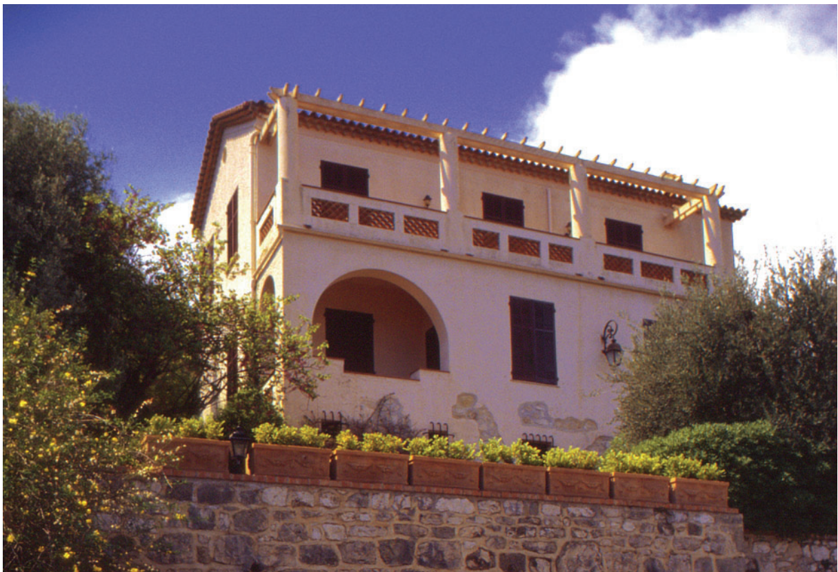
Deze villa in Roquebrune-Cap-Martin was Van Meegerens woning van 1932 tot 1938

(Deventer, 10 oktober 1889 – Amsterdam, 30 december 1947) was een Nederlands kunstschilder en kunstvervalser. Hij werd vooral bekend door zijn vervalsingen van werken van Vermeer.